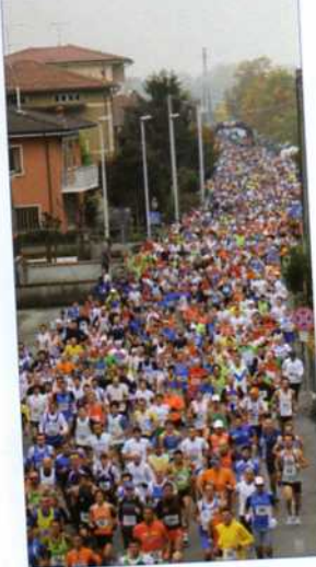
Partenza edizione 2010

Pacco gara garantito ai primi 1000 iscritti