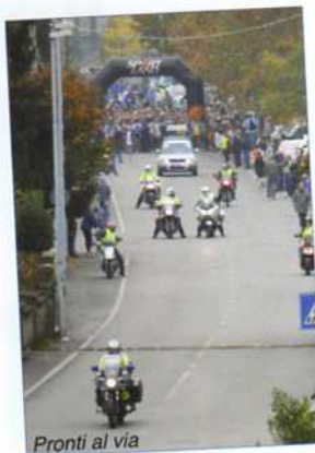
Pronti al via

www.atleticacarpenedolo.it - www.podisti.net